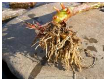
La balsamine de l'Himalaya s'extrait facilement du sol du fait de son système racinaire réduit.

A répéter durant 2 à 3 ans pour épuiser la banque de graines contenue dans le sol.